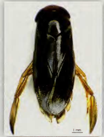
Fig. 1.- Habitus de Corixa affinis Leach (♂)

Distribución y hábitat: elemento de amplia distribución paleártica (Polhemus et al. [21]). Se cita para la isla de la Palma por primera vez en este trabajo. Se ha